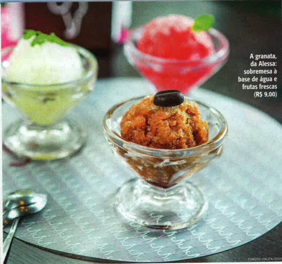
A granata, da Alessa: sobremesa à base de água e frutas frescas (R$ 9,00)